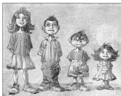
"Je suis l'a n e d'une fratrie de 4 enfants sourds."

Un fonds d'ouvrages de paroles de taulards est  galement   votre disposition.