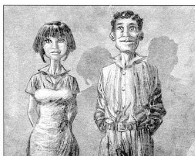
"Nos parents sont entendants."